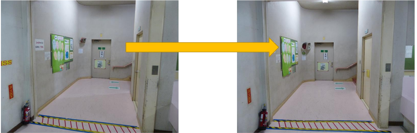
第2校舎1階、階段の曲がり角

そこで、ATMの操作盤や航空機の手荷物入れ、エレベーターの出入り口などに取り付ける業務用ミラーの専門会社「コミー株式会社」（川口市）さんに相談したところ、「子どもたちの安全のために」と協力して下さることになりました。