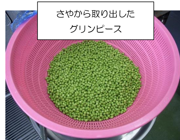
さやから取り出したグリーンピース

八百屋さんから、さやつきで8kgのグリーンピースを納品してもらいました。さやむきすると、グリーンピースは3kgほどになりました。お湯で2分ゆでて、塩をまぶし、炊きあがったご飯に混ぜました。