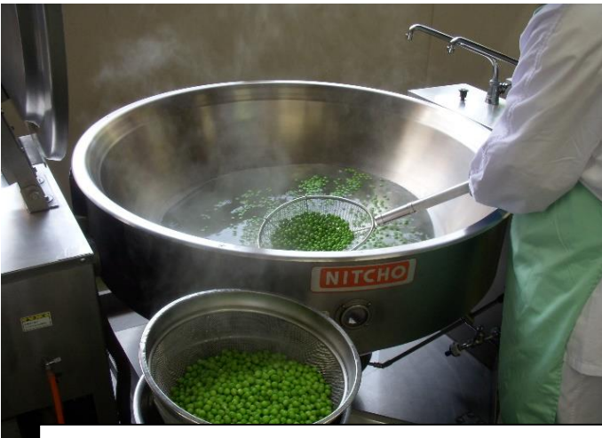
グリーンピースをゆでる様子

2年生のみなさんがむいたグリーンピースは、「グリーンピースご飯」にしました。プチッとはじける食感と、生のグリーンピースでしか味わえない旬のおいしさに、子どもたちもビックリしていました。