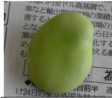
さやの中のそらまめ

みなさんが心をこめてむいてくれた野菜を、給食室で調理し、全校でおいしくいただきました。体験活動を通して、目や手のひら、鼻、口の中で季節を感じることができました。